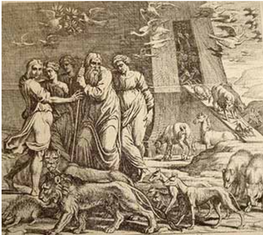
L'Arche de Noé

«Et Dieu leur dit: remplissez la terre, et l'assujettissez; et dominez sur les poissons de la mer, sur les oiseaux du ciel, et sur tout animal qui se meut sur la terre». Genèse 1-28.